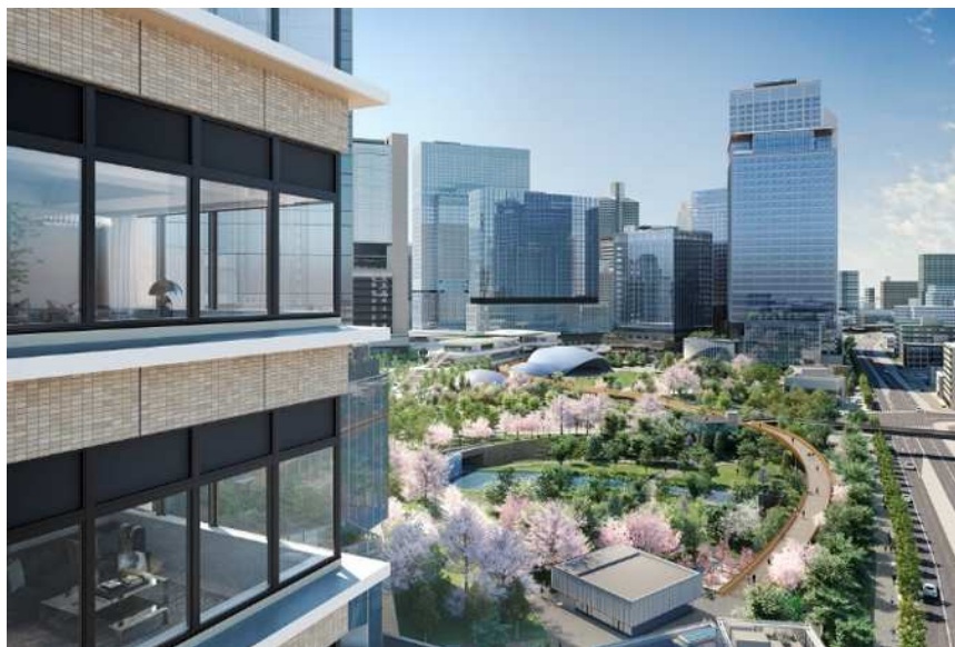
「うめきた公園」が眼前に広がるロケーションイメージ

都市公園「うめきた公園」を中心に配したグラングリーン大阪は、西日本最大のターミナル・JR大阪駅のすぐそばに誕生する、合わせて約9.1haの大規模複合開発であり「みどり」と融合した生命力あふれる都市空間で、オフィスや商業施設などさまざまな機能も有しています。当レジデンスは、その「北街区」に位置しており、開発計画の最大の特徴である「うめきた公園」が眼前に広がるロケーションとなっています。