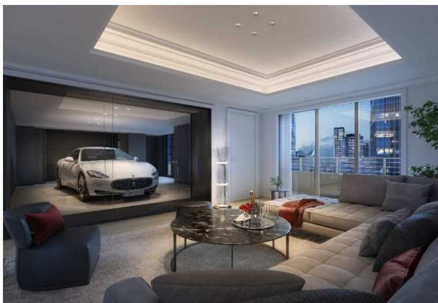
カーギャラリー付き住戸