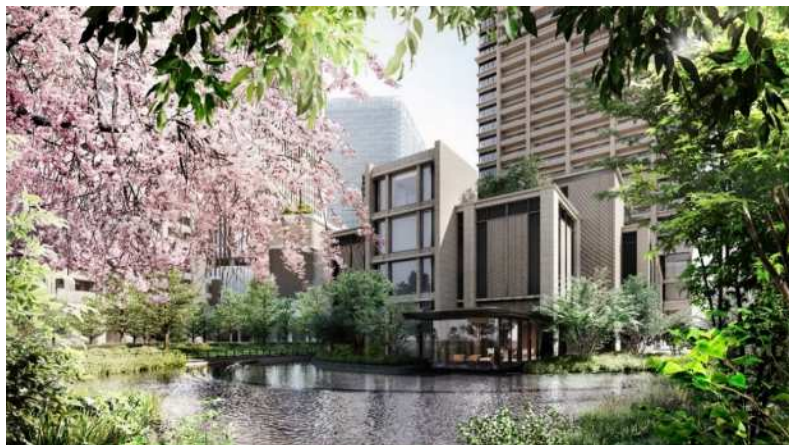
自然と共生する緑と水の外構

当レジデンスに住まう方々に対し、安全・安心や快適性、そして環境性能を追求した高い付加価値を提供することにより、一層の質の高い暮らしを実現します。