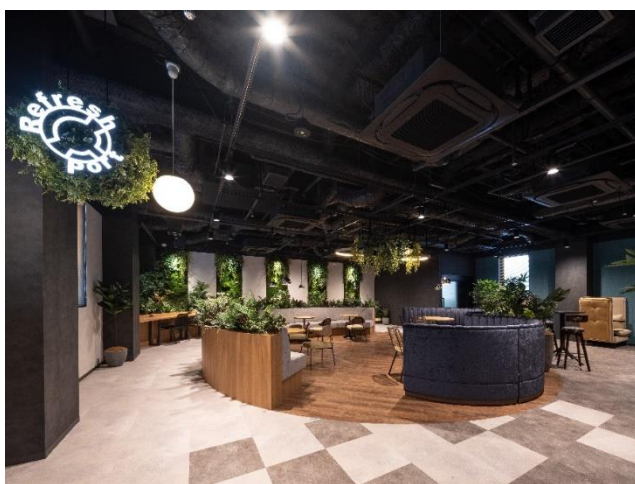
3階リフレッシュスペース