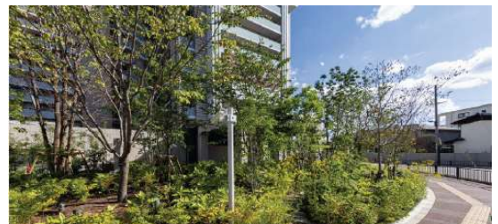
サクラのロータリー