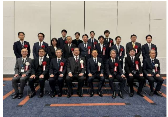
おおさか環境にやさしい建築賞 受賞式