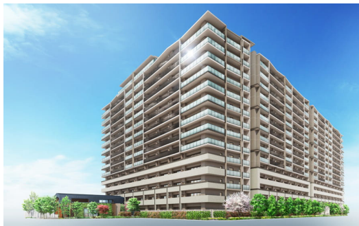
シエリアシティ星田駅前（総戸数382戸）

※2 投資用マンションを除いた順位です。投資用マンションとは、自己の居住目的ではなく、賃貸収入の確保や転売目的で個人が購入するマンションを指します。主に都市部のワンルームマンションが対象となります。