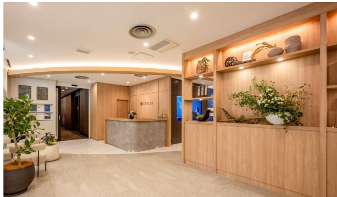
本サロンエントランス

当社は今後も関西電力グループの総合不動産デベロッパーとして、オール電化マンションの供給を通じ、安心して快適な暮らしを提供してまいります。本サロンの開設を契機に、東海圏での分譲住宅事業をより一層加速させてまいります。