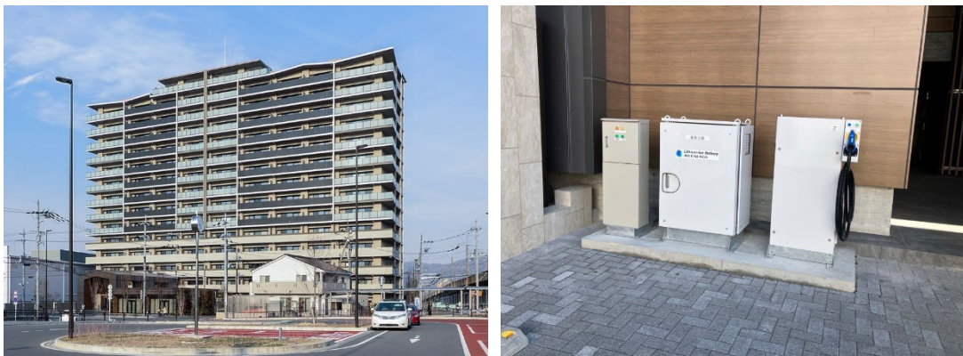
「シエリアシティ星田駅前」の外観(左)と V2X システム(右)

太陽光発電で電気自動車・蓄電池を充電し、停電時は蓄電した電気エレベーターの利用が可能